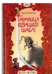
2006 Видавництво Старого Лева